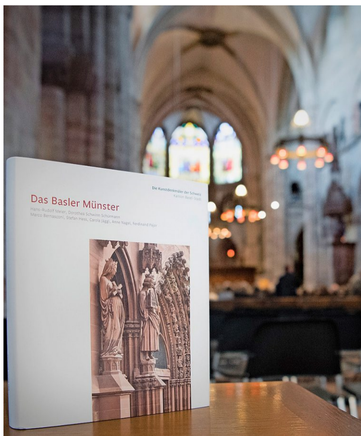
Das historisch, archäologisch und kunstgeschichtlich umfassende Werk führt in die Geschichte des Basler Wahrzeichens.

Auf rund 500 Seiten gehen sie auf Archäologie, Geschichte und Architektur sowie auf die Male-rien, Skulpturen, Glasfenster und Grabdenkmäler des Basler Münsters ein. Mitunter hat man