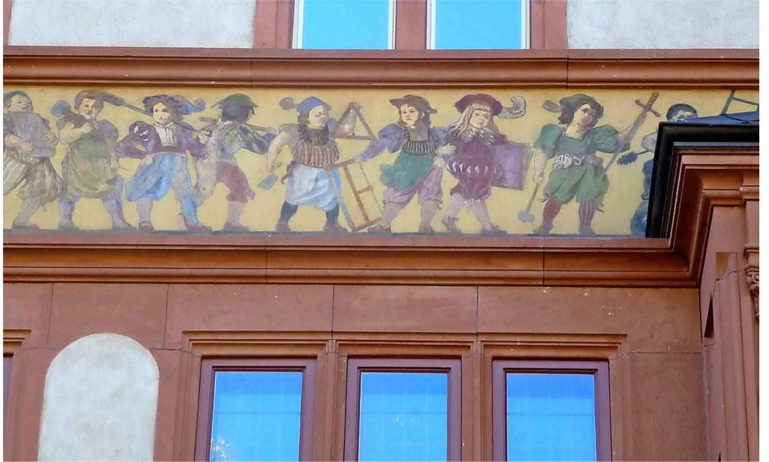
Wie ein Zunfthaus sieht es aus: Das 1898 fertig erstellte Vereinshaus des evangelischen Arbeitervereins, das 1939 zum Gemeindehaus von St. Theodor bestimmt wurde.

Der eine trägt eine schwere Steinplatte, der andere einen Hammer und der dritte einen Schuh. Ein Maurer mit Schurz, Pflasterkelle und Winkelmass ist ebenso zu erkennen wie der Schreiner mit seiner Säge und der Architekt mit der Mappe voller Planzeichnungen. Auch ein Gärtner mit zwei Spalierbäumchen und ein Schneider sind dabei.